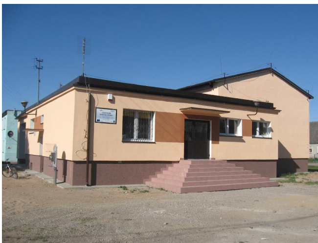
Budynek świetlicy budynek biblioteki

Świetlica wiejska w istnieje od 1993 roku. W budynku świetlicy jedno pomieszczenie zajmuje biblioteka, jedno Ochotnicza Straż Pożarna. Świetlica funkcjonuje przez pięć dni w tygodniu po sześć godzin dziennie. Dodatkowo codziennie otwarta jest biblioteka przez dwie godziny. Szkoła zapewnia dzieciom i młodzieży zajęcia w godzinach porannych, najpóźniej do godziny 15 00 , po zajęciach w szkole dzieci nie mają miejsca, w którym mogłyby spędzać swój wolny czas. Wychodząc naprzeciw potrzebom mieszkańców i młodzieży świetlica otwarta jest w godzinach popołudniowych (12 00 - 20 00 ). Dlatego poprawienie warunków lokalowych świetlicy jest tak istotne dla życia mieszkańców wsi.