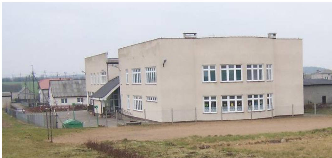
Szkoła Podstawowa w Turzy Wielkiej

Parafia Matki Bożej Różańcowej w Turzy Wielkiej - parafia rzymskokatolicka w diecezji toruńskiej, w dekanacie działdowskim, z siedzibą w Turzy Wielkiej