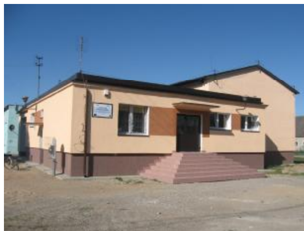
Budynek świetlicy budynek biblioteki

Świetlica wiejska istnieje od 1993 roku. W budynku świetlicy jedno pomieszczenie zajmuje biblioteka, jedno Ochotnicza Straż Pożarna. Świetlica funkcjonuje przez pięć dni w tygodniu po sześć godzin dziennie. Dodatkowo codziennie otwarta jest biblioteka przez dwie godziny. Szkoła zapewnia dzieciom i młodzieży zajęcia w godzinach porannych, najpóźniej do godziny 15 00 , po zajęciach w szkole dzieci nie mają miejsca, w którym mogłyby spędzać swój wolny czas. Wychodząc naprzeciw potrzebom mieszkańców i młodzieży świetlica otwarta jest w godzinach popołudniowych (12 00 - 20 00 ). Dlatego poprawienie warunków lokalowych świetlicy jest tak istotne dla życia mieszkańców wsi.