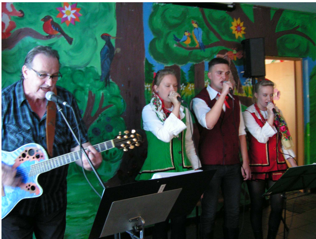
Zespół "Kapela Jędruli"

piosenki biesiadne wykonywane w nowoczesnej formie.