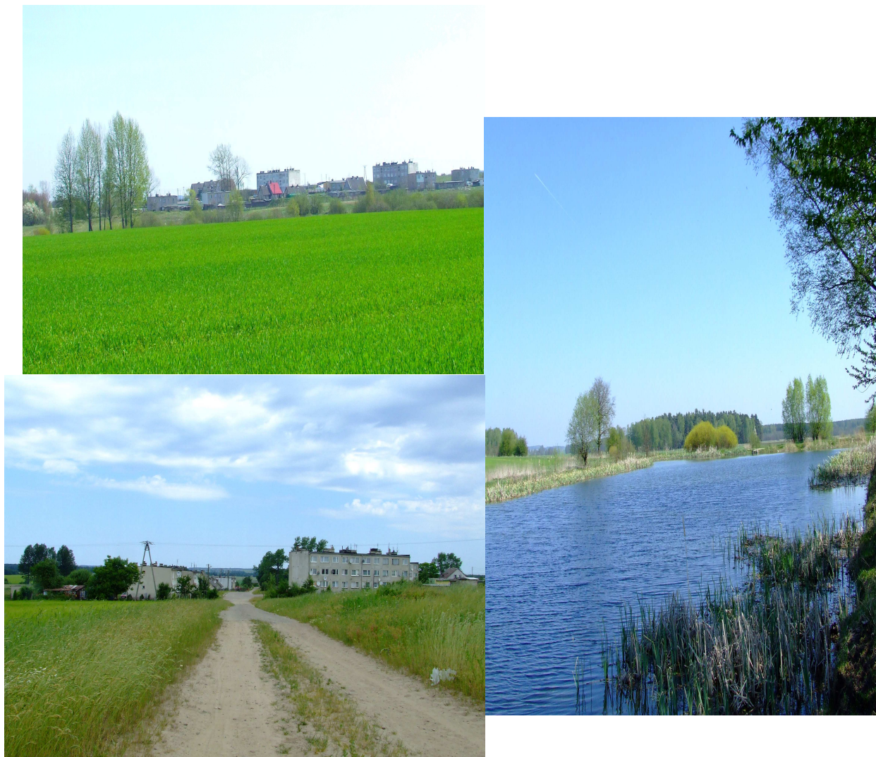
Otoczenie Sołectwa Pożary

teren o korzystnych warunkach fizjograficznych dla rozwoju osadnictwa.