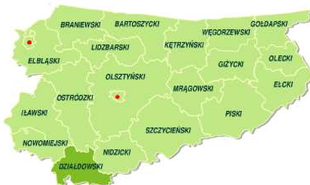
Rys. nr 1. Powiat Działdowski na tle województwa warmińsko – mazurskiego

Sołectwo Pożary to sołectwo w województwie warmińsko – mazurskim w powiecie działdowskim, który został utworzony w 1999r. w ramach reformy administracyjnej i jest najbardziej wysuniętym powiatem na południe województwa warmińsko – mazurskiego. W latach 1975-1998 miejscowości Pożary i Wilamowo nleżały administracyjnie do województwa ciechanowskiego.