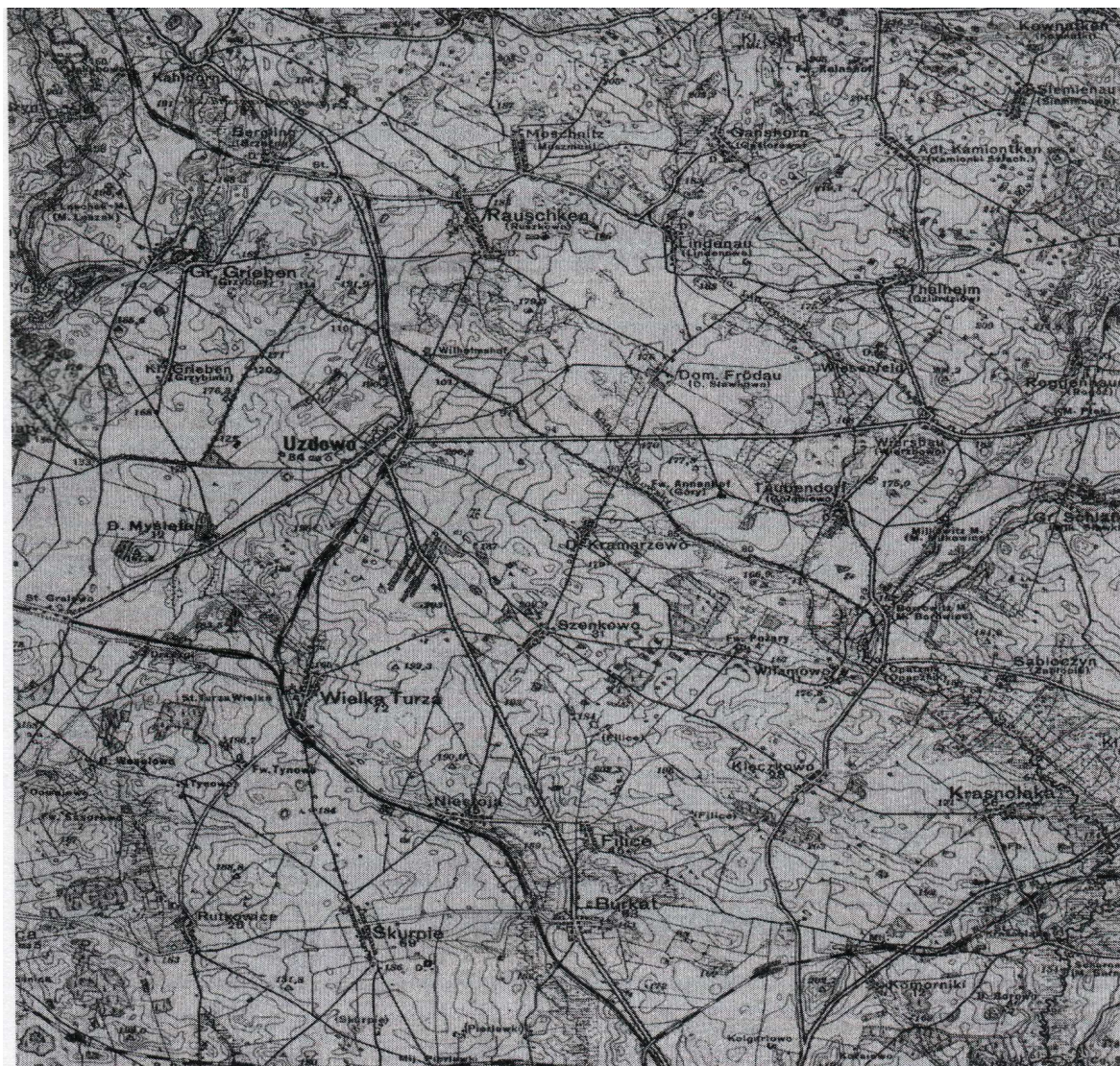
Rys. Nr 3. Fragment mapy z lat dwudziestych XX wieku