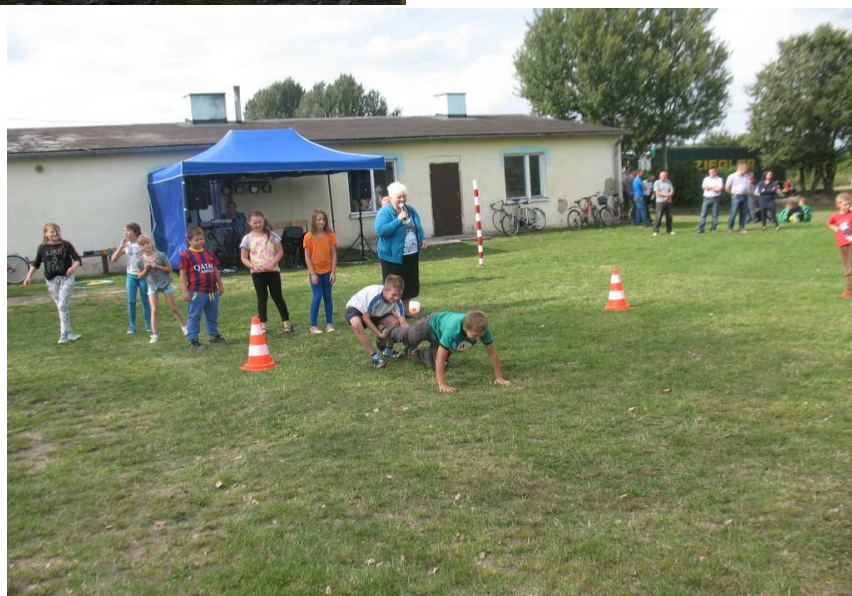
Świetlica w Pożarach