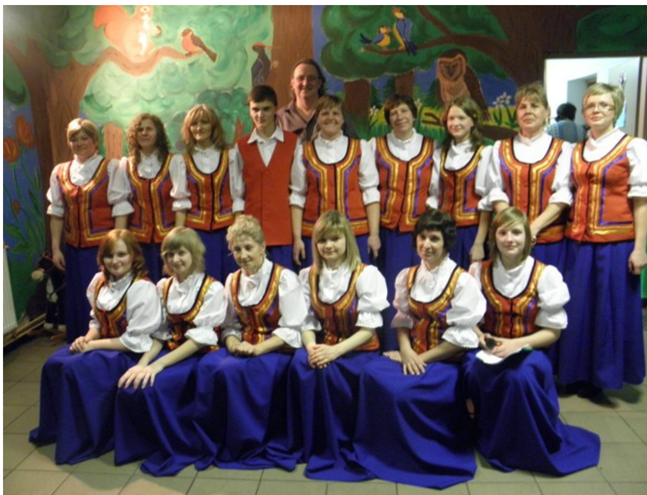
Zespół "Wesoła ferajna"

Sołectwo Pożary może poszczycić się faktem, iż posiada dwa zespoły : biesiadny „Wesoła Ferajna” , który występuje na imprezach gminnych, powiatowych oraz młodzieżowy zespół „Kapela Jędruli” .