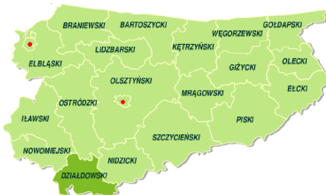
Rys. nr 1. Powiat Działdowski na tle województwa warmińsko – mazurskiego

Sołectwo Pożary to sołectwo w województwie warmińsko – mazurskim w powiecie działdowskim, który został utworzony w 1999r. w ramach reformy administracyjnej i jest najbardziej wysuniętym powiatem na południe województwa warmińsko – mazurskiego. W latach 1975-1998 miejscowości Pożary i Wilamowo nleżały administracyjnie do województwa ciechanowskiego.