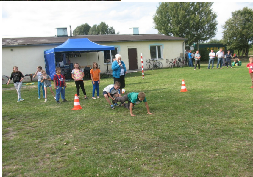
Świetlica w Pożarach